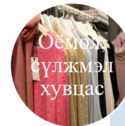
Оёмолу сүлжмэл хувцас