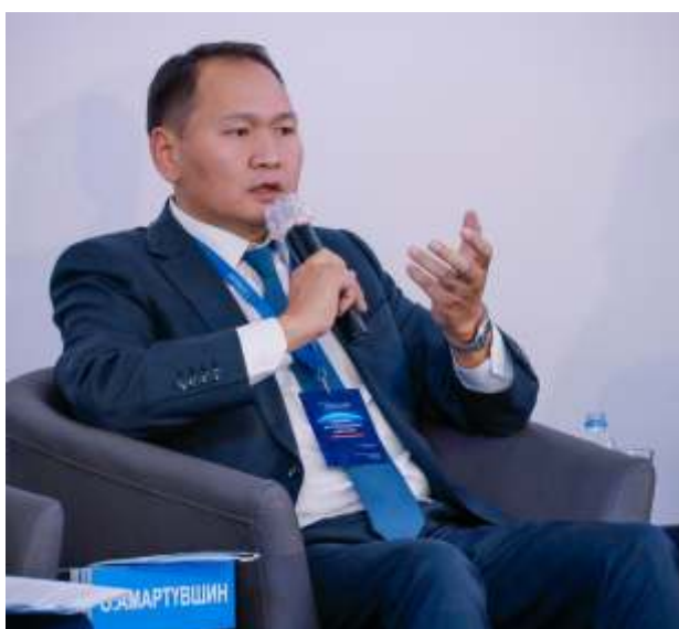
МҮХАҮТ-ын Ерөнхийлөгч О.Амартүвшин:

Дотоодын аж ахуйн нэгжүүддээ итгэж, дэмжихгүй бол гадны хөрөнгө оруулагчид яаж итгэж манай улсад хөрөнгө оруулах вэ